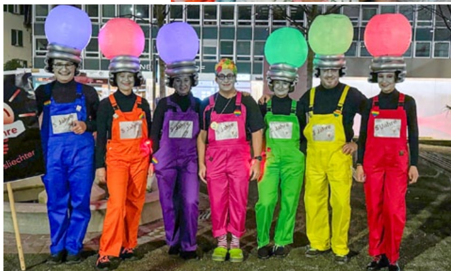
Mer bränned für d'Fasnacht! – www.schlussliechter.ch